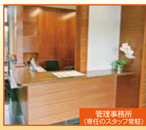
管理事務所 (専任のスタッフ常駐)