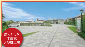
広々とした平置き大型駐車場