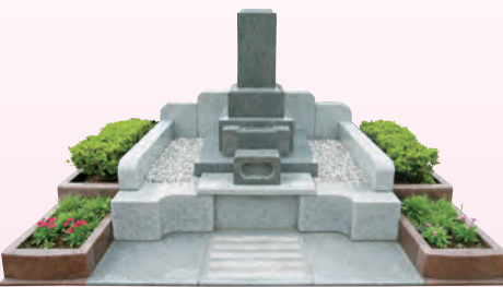
ガーデニング墓所