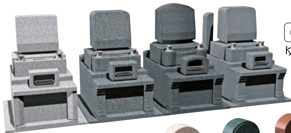
0.80㎡ ゆとり区画 施工例