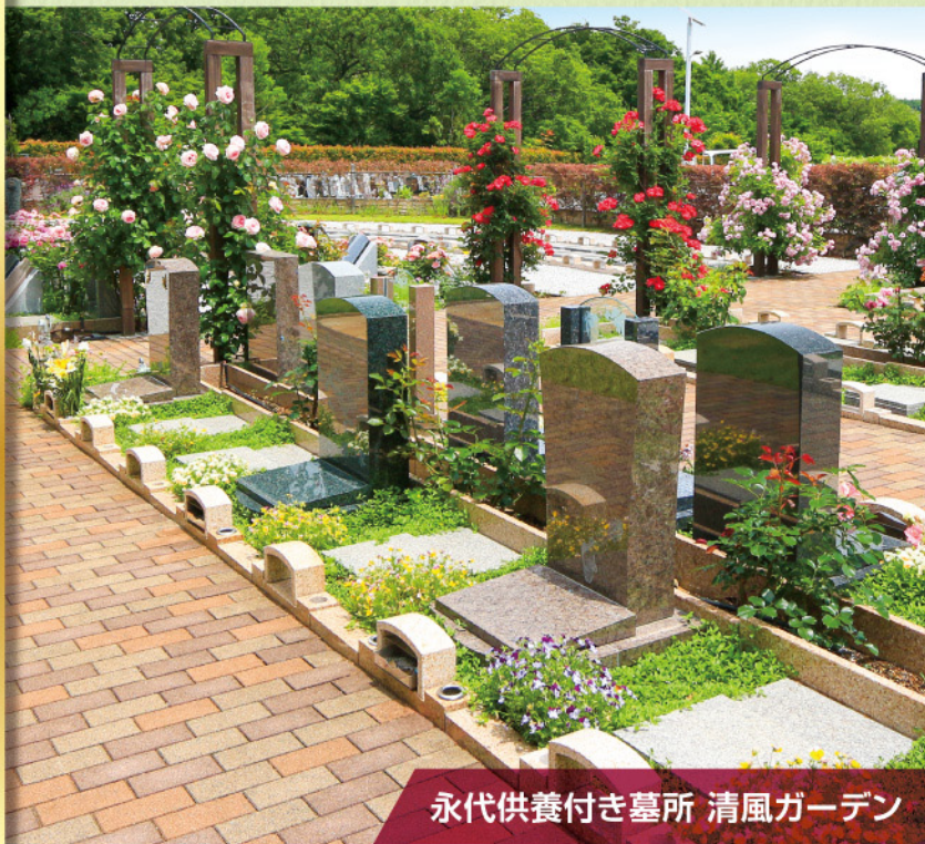
永代供養付き墓所 清風ガーデン

単身者の方からご家族のお墓まで 全ての方が納得できるお墓づくりを応援します。 想いを込めたこだわりのお墓に、将来も安心できるお墓 大切なペットと一緒に眠れるお墓など 私たちは眠りの環境をプロデュースする霊園です。