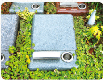
永代供養付き一般墓所(選択可)