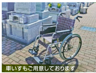
車いすもご用意しております