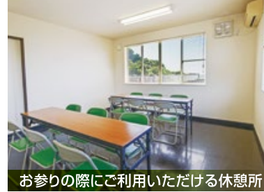
お参りの際にご利用いただける休憩所