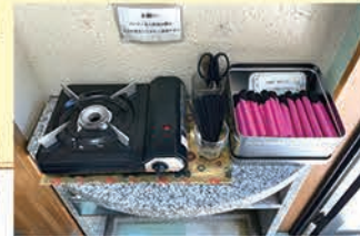
●お線香は無料でご用意