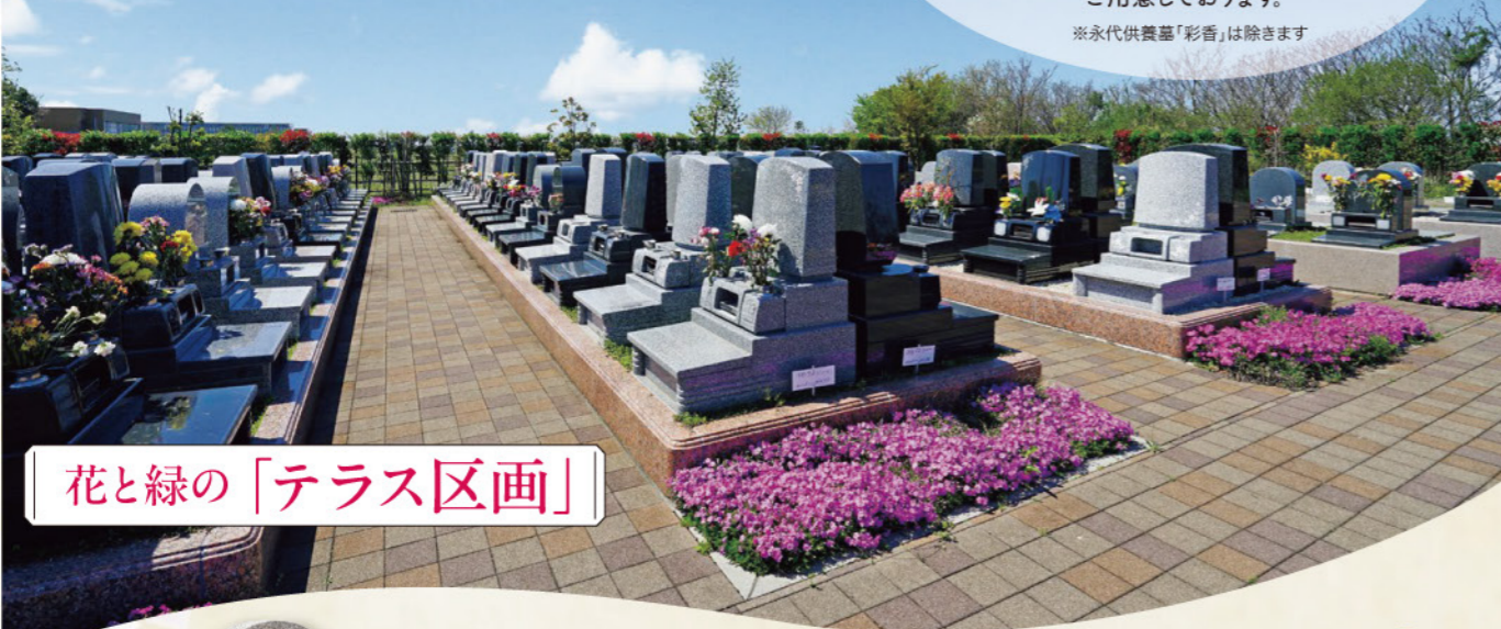
花と緑の「テラス区画」

当霊苑では、大切な家族の一員である、 愛するペットといっしょに眠れるお墓を ご用意しております。 ※永代供養墓「彩香」は除きます