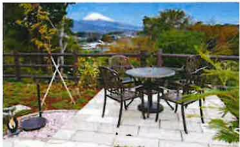
「結の杜」は昨年夏に望嶽の丘霊苑内の高台に完成しました。 富士山・箱根・伊豆周辺を望む風光明媚な絶景ロケーションです。

お問合せ お申し込み 資料請求は みしま望嶽の丘霊苑 樹木葬墓 結の杜 ☎411-0022 静岡県三島市川原ヶ谷216 ☎0800-200-5000